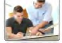
Un stagiaire تحت التمرين

ملحوظه :- ( السؤال سؤال عن ال من نيت خدم ) faire ( وعن دال ب نيت خدم ) être )